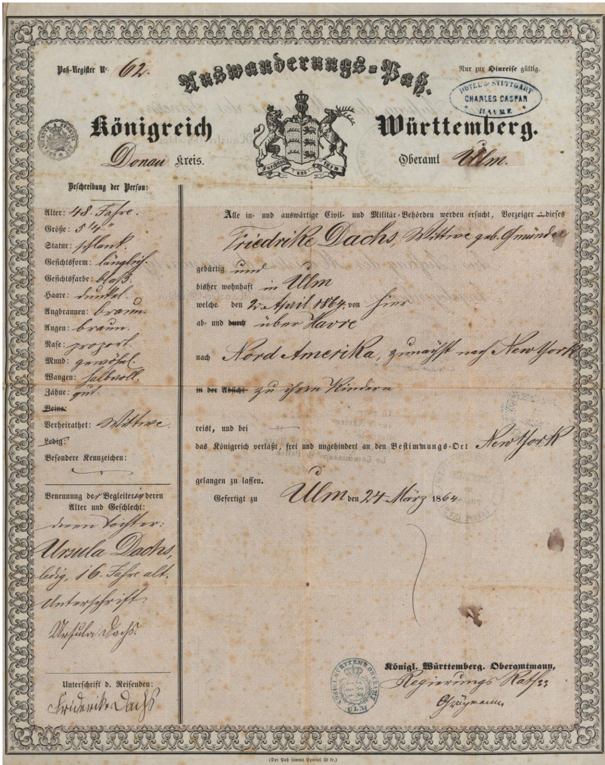
Auswanderungspass für Friedrike Dachs und ihre Tochter Ursula, 1864 (StA Ulm, B 122/03 Nr. 11)