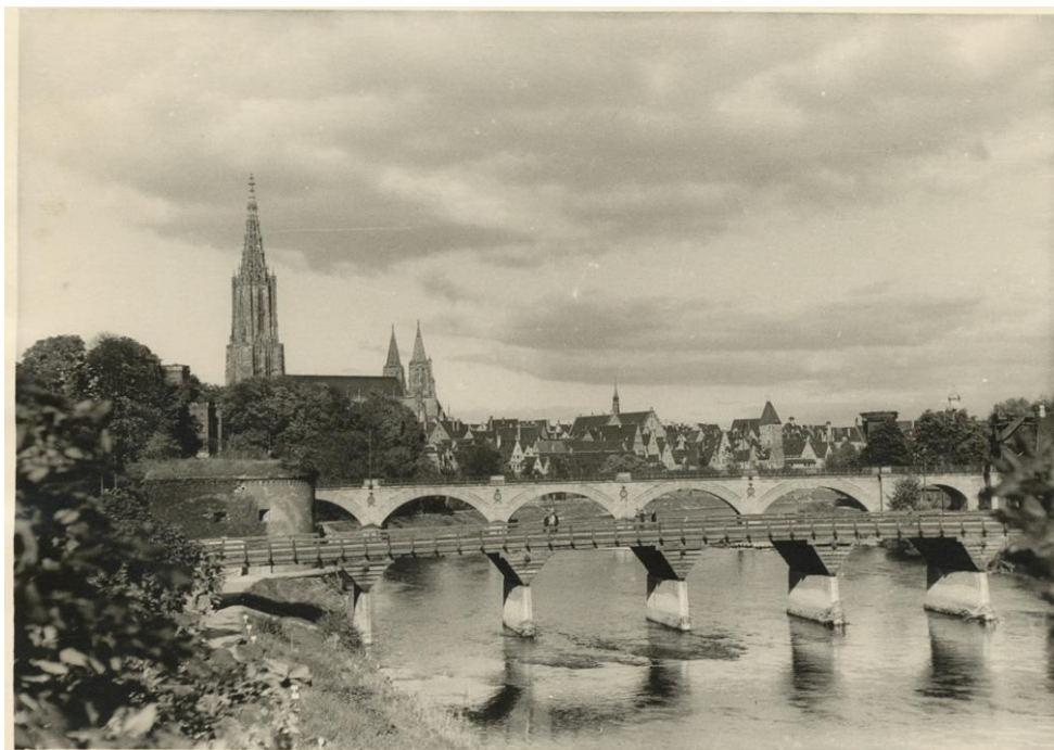
Schillerbrücke im Jahr 1943

Um die Verkehrsverhältnisse im Ulmer/Neu-Ulmer Westen über den „Langen Steg“ (=Wiblinger Straße) nach dem Vorort Wiblingen zu verbessern, wurde am 18. Dezember 1928 zwischen den beiden Städten in Verlängerung der Schillerstraße der Bau einer dritten Donaubrücke vereinbart. Auf steinernen Pfeilern ruhend, war die Brücke in Holz konstruiert.