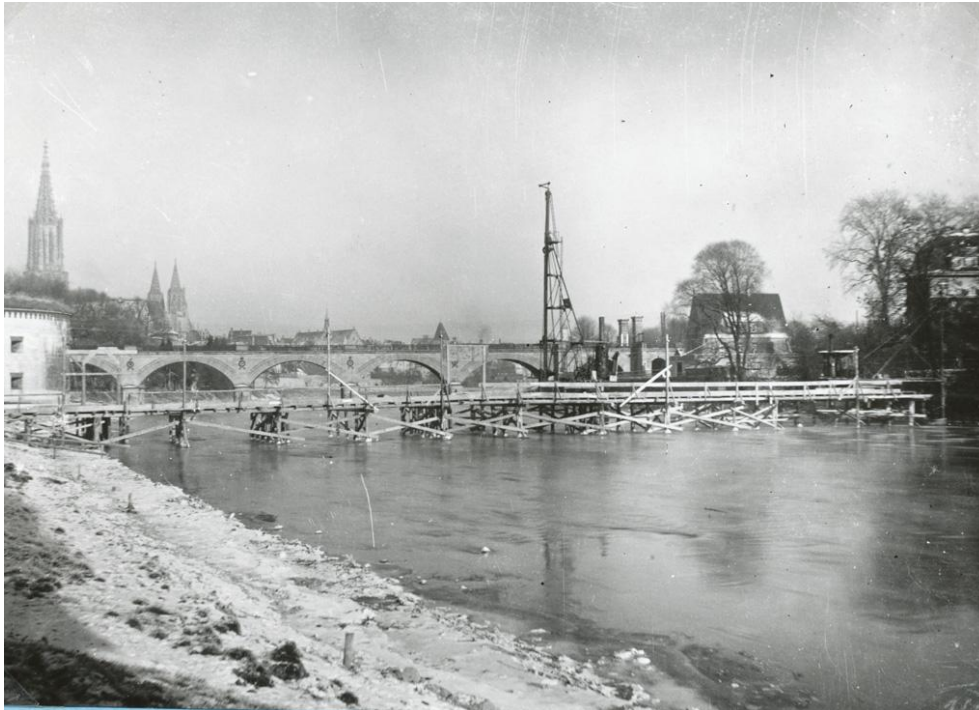
Schillerbrücke im Bau 1927