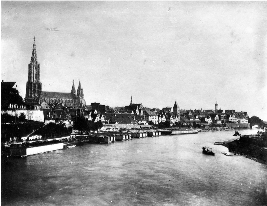
Blick von der Eisenbahnbrücke auf Ulm, 1894. Am Ulmer Donauufer liegen die Badehäuser.